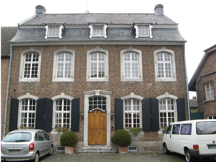
Wohnhaus am Kirchplatz 6 in Wegberg-Beeck