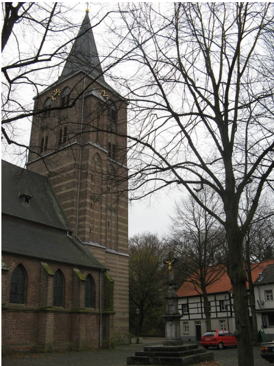
Katholische Pfarrkirche St. Vinzenz in Wegberg-Beeck