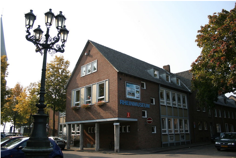
Das Gebäude des Rheinmuseums am Martinikirchgang in Emmerich am Rhein (2008).