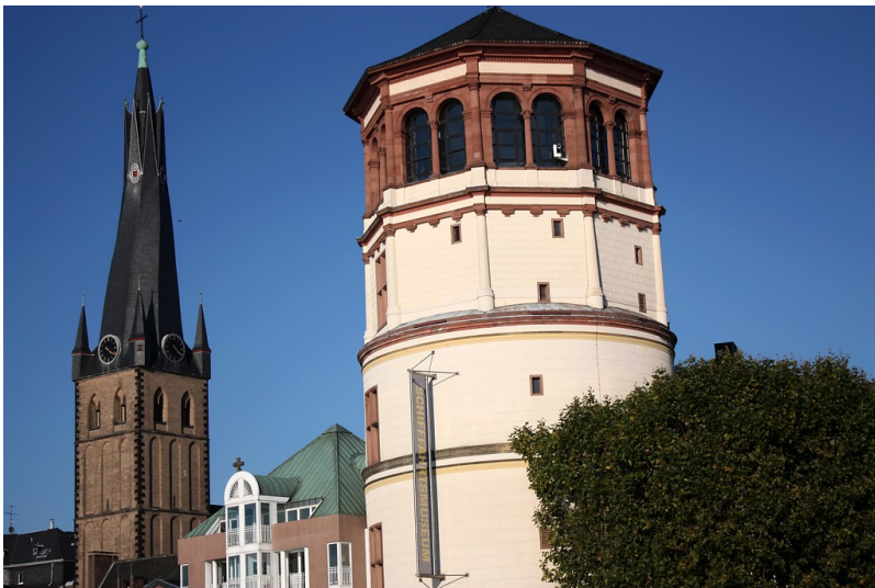
Turm der Kirche St. Lambertus und der Schlossturm in Düsseldorf (2010)