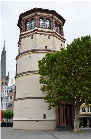
Das Schifffahrtsmuseum (ehemaliger Schlossturm) auf dem Burgplatz in Düsseldorf (2014)