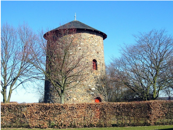
Gesamtansicht der Fritzdorfer Windmühle (Windmühlenturm Fritzdorf, 2011).