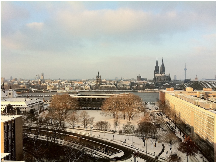
Blick auf den Kölner Dom und die Kölner Altstadt im Winter von der gegenüber liegenden Deutzer Rheinseite aus (2010)