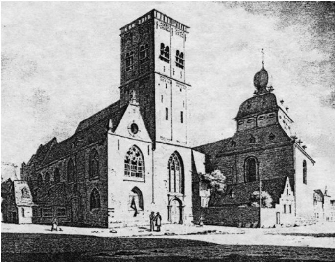
Pfarrkirche St. Jakob und Stift St. Georg auf dem Waidmarkt in Köln