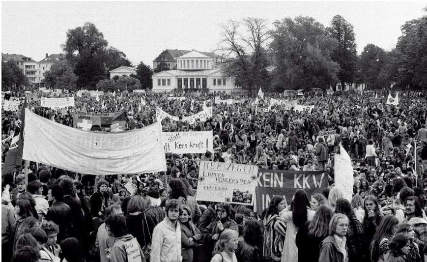
Anti-Atomkraft-Demonstration auf dem Bonner Hofgarten am 14. Oktober 1979, im Hintergrund das Akademische Kunstmuseum