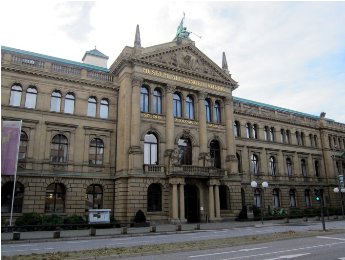
Teilansicht des Zoologischen Forschungsmuseums Alexander Koenig, Adenauerallee 160, in Bonn (2014)