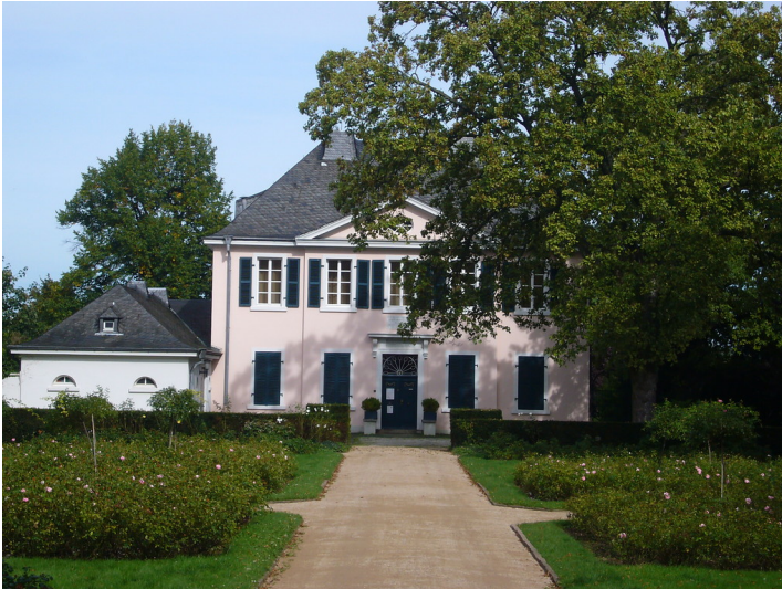
Ernst Moritz Arndt Haus in der Bonner Adenauerallee (2011)