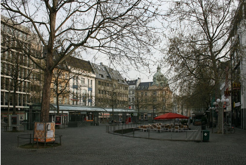
Friedensplatz mit Bushaltestelle (2012)