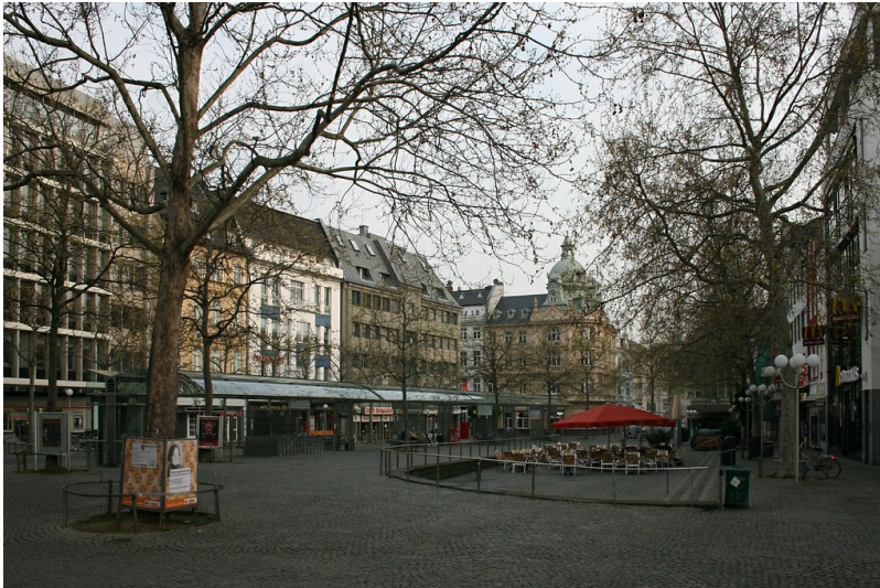
Friedensplatz mit Bushaltestelle (2012)