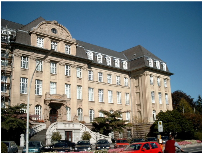
Ehemalige Landwirtschaftskammer Rheinland in Bonn (2002)