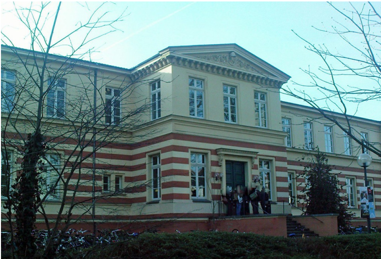
Altes Chemisches Institut, Meckenheimer Allee 166-168 (2012)