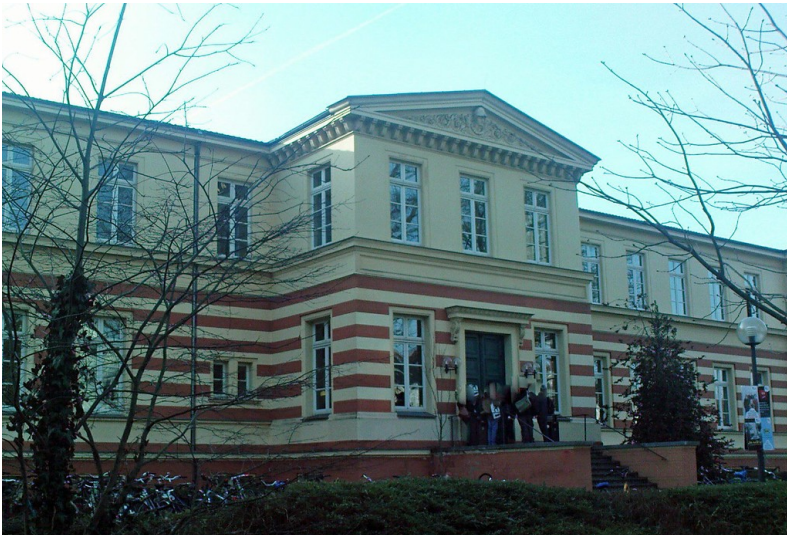
Altes Chemisches Institut, Meckenheimer Allee 166-168 (2012)