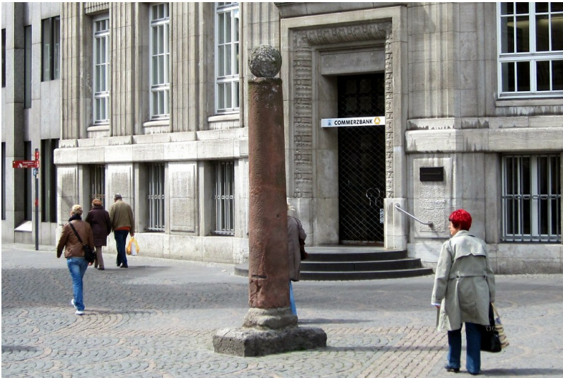
Der Bonner Pranger auf dem Münsterplatz (2012)