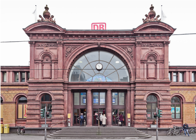
Die Eingangshalle des Bonner Hauptbahnhofs (2014). Das 1885 fertiggestellte Bahnhofsgebäude spiegelt die repräsentative Architektur der Preußen wider.