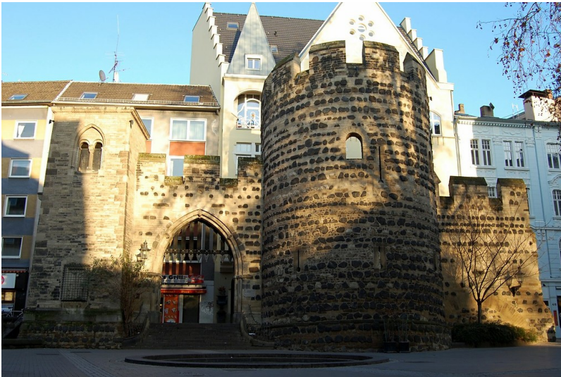
Sterntor vom Bottlerplatz aus gesehen (2012)