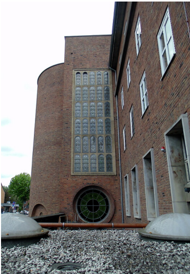
Ansicht von Westen aus auf die Apsis der Kirche des Sankt Elisabeth-Krankenhauses Hohenlind in Köln-Lindenthal (2020).