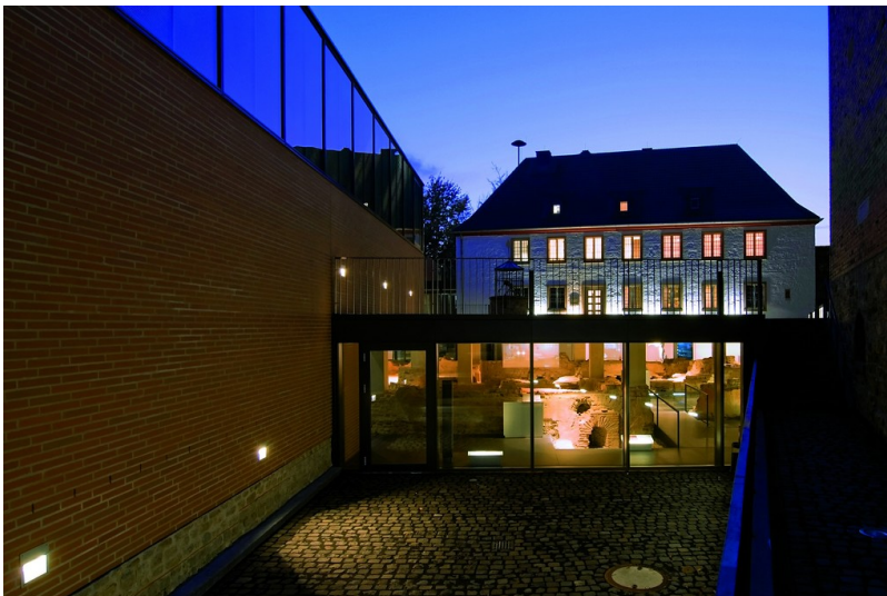
Römerthermen Zülpich - Museum der Badekultur: Blick von Nordosten auf die Römerthermen Zülpich Museum der Badekultur mit dem Anbau des Warmbades.