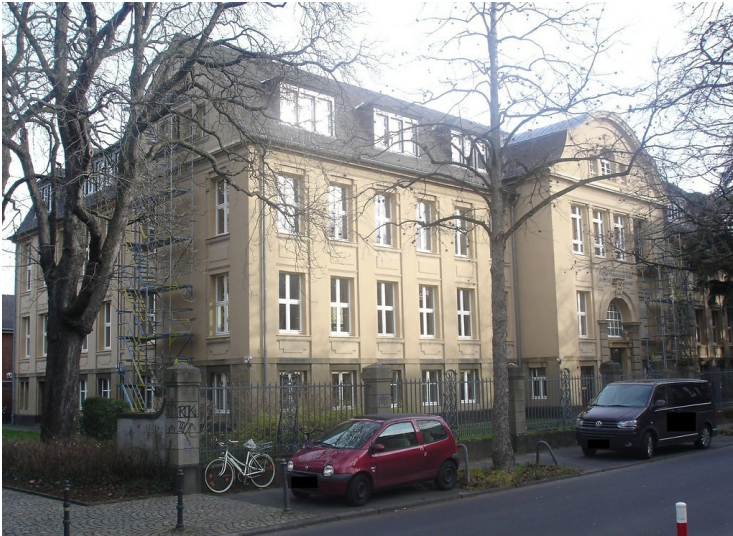
Geologisches Institut der Bonner Universität (2012) Fotograf/Urheber: Marx, Marcel, GIUB 2012