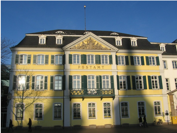
Altes Postamt am Münsterplatz (2012)