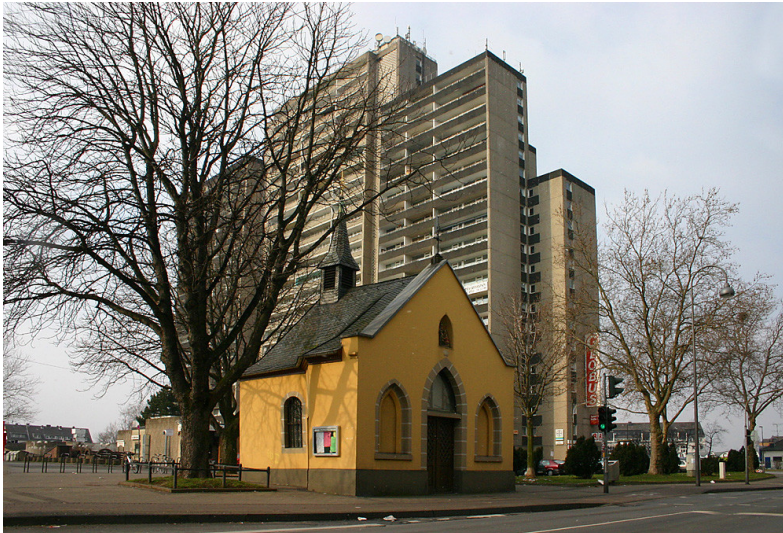
Rochuskapelle vor dem Westcenter in Köln-Bickendorf (2005)