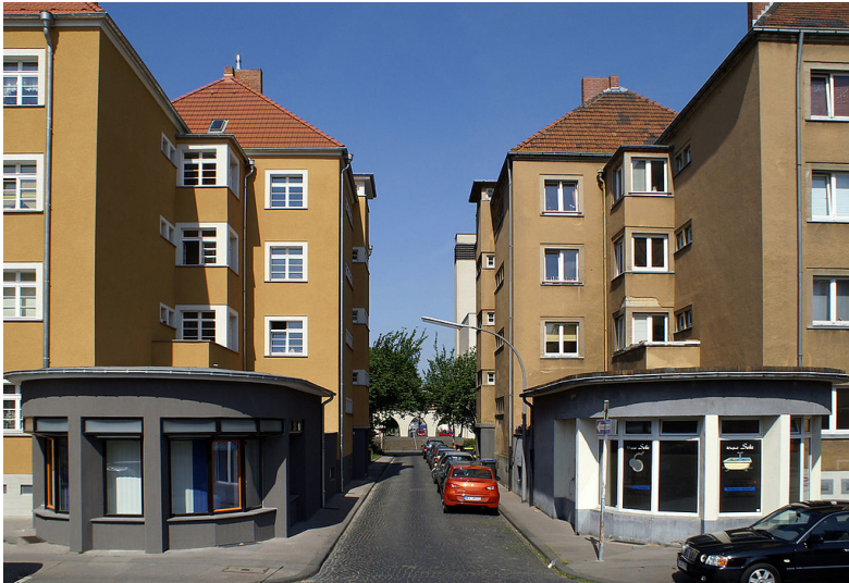
Wacholderweg in Köln-Bickendorf mit typischer Wohnbebauung und zwei "Büchchen" (2010).