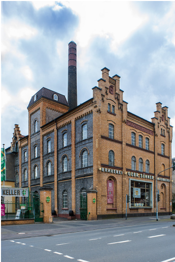
Brauerei und Brennerei Gebrüder Sünner in Köln-Kalk (2012)