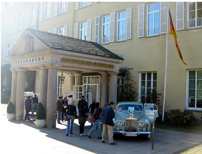
Der Eingang zum Steigenberger Grandhotel auf dem Petersberg (2008).