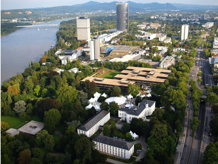
Luftbildaufnahme: Das frühere Regierungsviertel in Bonn zwischen Rhein und Adenauerallee / Willy-Brandt-Allee. Vorne ist das Palais Schaumburg mit dem dahinter liegenden früheren Bundeskanzleramt und den Bundestagsgebäuden zu sehen, dahinter das frühere Abgeordnetenwohnhaus "Langer Eugen" und der Post Tower vor dem Hintergrund des Siebengebirges (2010).