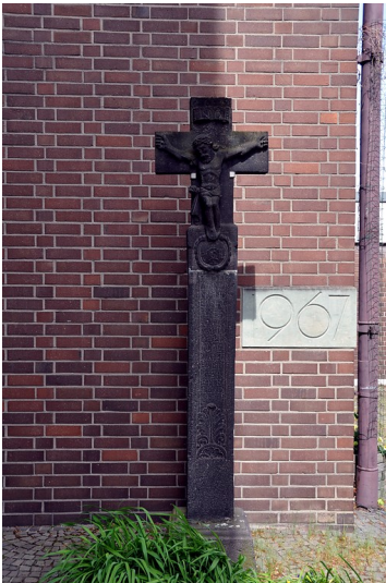
Wegekreuz an der Katholischen Kirche Sankt Winfried in Bonn (2016)