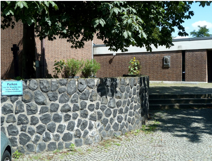
Windmühlenstumpf an der Kirche Sankt Winfried in Bonn (2017)