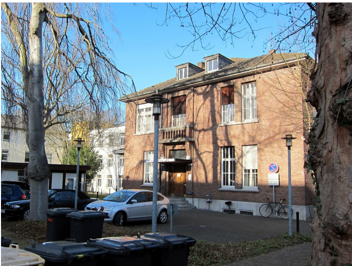
Das heutige Wohnhaus Raiffeisenstraße 1 in Bonn (2015), zeitweise Gästehaus des Landes Bayern.