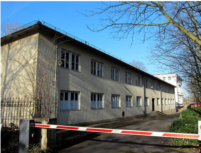
Die sogenannte Baracke in der Raiffeisenstraße in Bonn (2015)