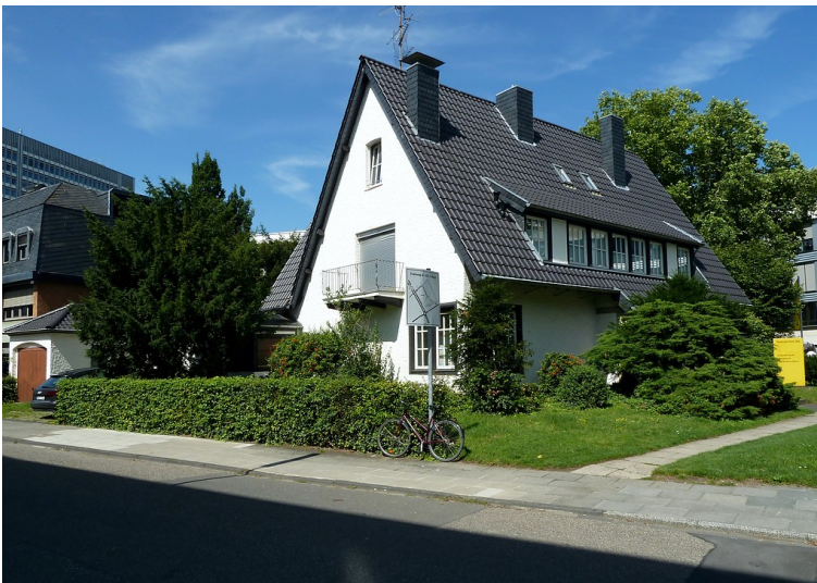
Wohnhaus Fritz-Schäffer-Straße 15 im Bonner Regierungsviertel (2017).