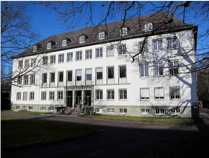
Raiffeisenhaus in der Adenauerallee in Bonn (2015)