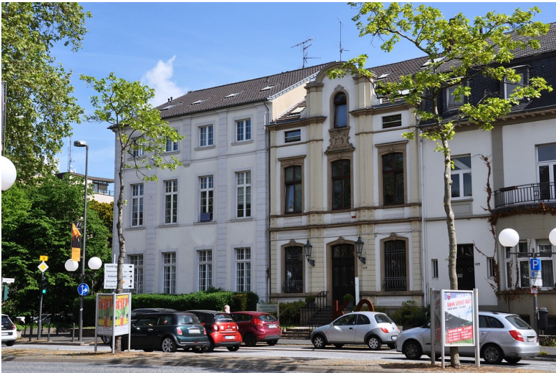
Wohnhaus Adenauerallee 115 in Bonn (2016), Katholisches Militärbischofsamt