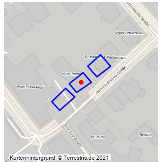
Kartenhintergrund: © Terrestris.de 2021