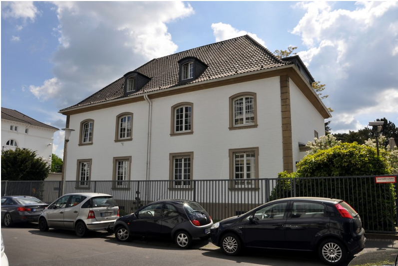
Wohnhaus Kaiser-Friedrich-Straße 12-14 in Bonn (2016). Im Gebäude waren ehemals Büros des benachbarten Bundespräsidialamts untergebracht.