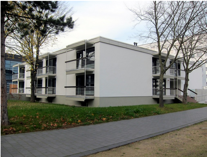
Wohnhaus Heussallee 11 in Bonn (2014)