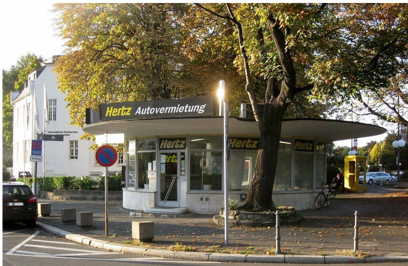
Der Pavillon der Fluggesellschaft Scandinavian Airlines System (so genannter "SAS-Pavillon", heute Büro und Wartehalle eines Autoverleihs) am Bundeskanzlerplatz in Bonn. Das Dach hat wegen des neben dem Pavillon wachsenden Baumes eine entsprechende Aussparung (2013)