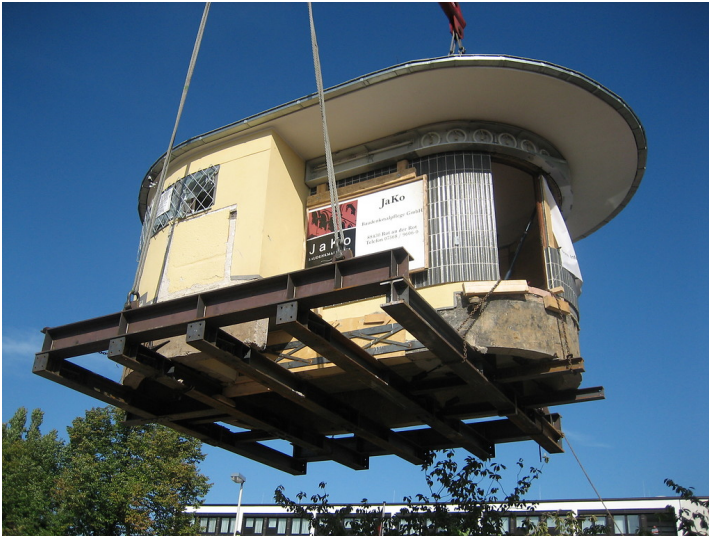
Ein Kran hebt das denkmalgeschützte "Bundesbüdchen", einen Kiosk im Bonner Regierungsviertel an, um diesen zu seinem Zwischenlager, einem Bauhof in Hersel, transportieren zu können (2006).