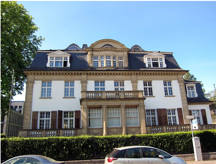
Villa Kurt-Schumacher-Straße 10 im Bonner Regierungsviertel (2015).