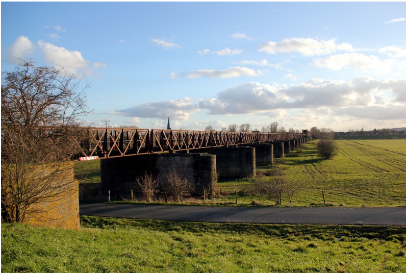
Der Hochwasserbrücke der Griethausener Eisenbahnbrücke in der Rheinaue (2016)