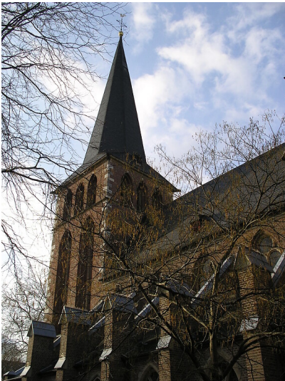
Katholische Pfarrkirche St. Margareta (2004)