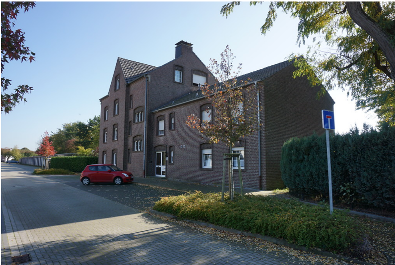
Empfangsgebäude des Bahnhofes Uedem (2017)