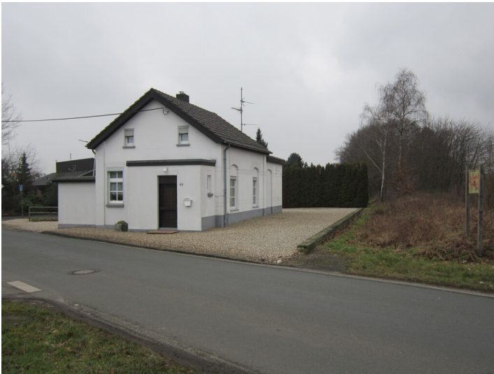
Ehemaliges Empfangsgebäude Bahnhof Asperden (2017)