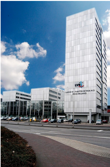
Blick auf das als "LVR-Haus" bezeichnete Verwaltungsgebäude des Landschaftsverbandes Rheinland in Köln-Deutz, gegenüber dem Deutzer Bahnhof am Ottoplatz gelegen (2004).