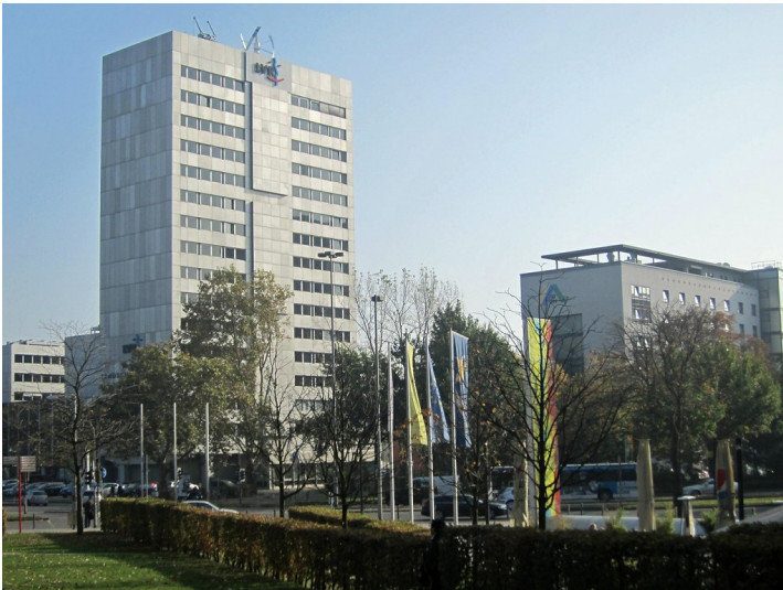
Früheres Ford-Hochhaus und heutige LVR-Haus in Deutz, rechts daneben die Deutzer Jugendherberge (2012)