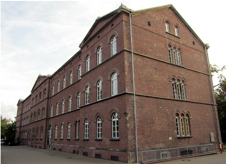
Gebäude der heutigen LVR-Kulturdienststellen in der ehemaligen Abtei Brauweiler (2011).