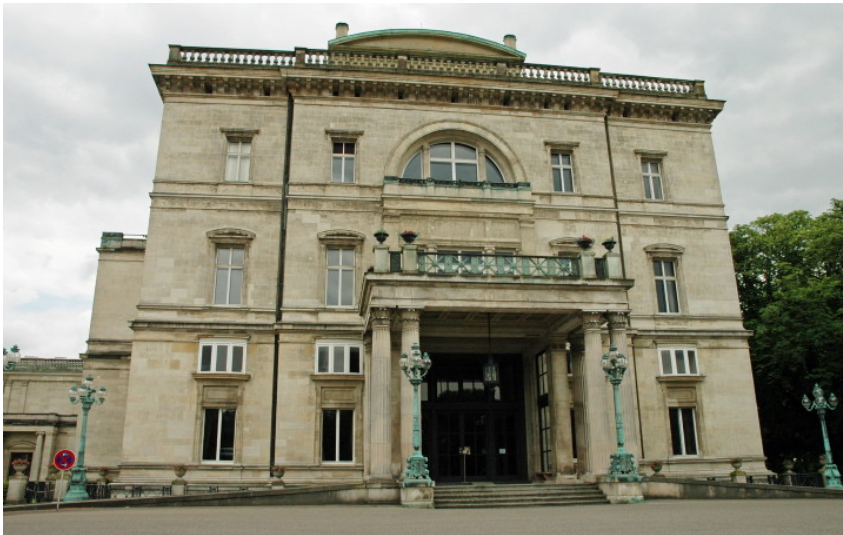
Villa Hügel in Bredeneu (2009)