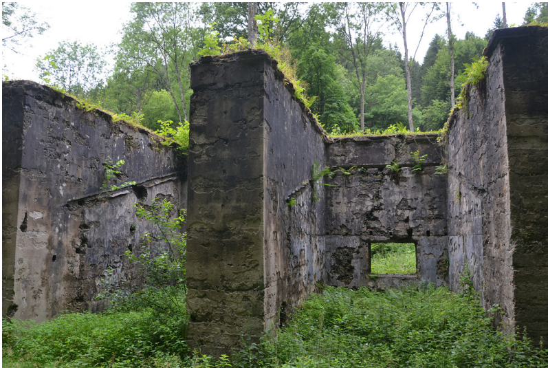
Ruine eines Gebäudes der Pulvermühle Elisenthal (2013)