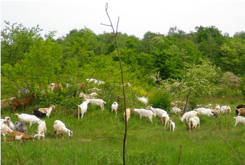
Ziegenbewirtschaftung in der Dellbrücker Heide (2011).