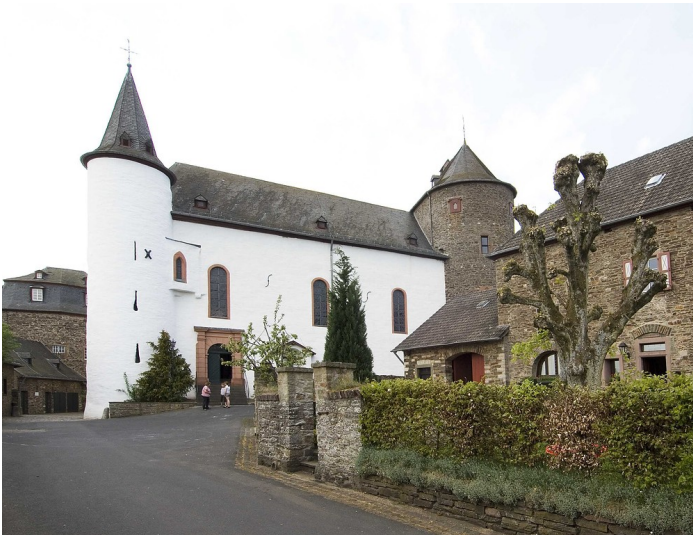
Teilansicht von Burg und Burgsiedlung Wildenburg (2011)