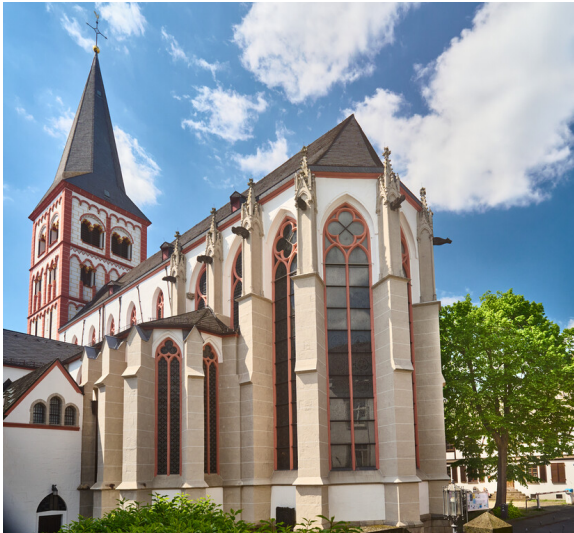
Ansicht der romanisch-gotischen Kirche Sankt Servatius in Siegburg mit dem Chor im Vordergrund (2023).